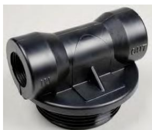
Vrchní hlava s 1"