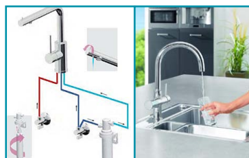
Zapojení s filtrem