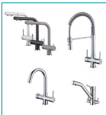
Možnost přibojednat duální baterii dle Vašeho výběru